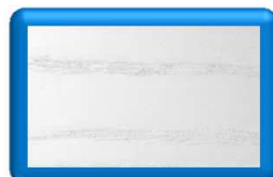
Frassino Laccato Bianco Poro Ap.