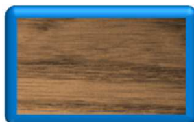
Frassino Tinto Noce