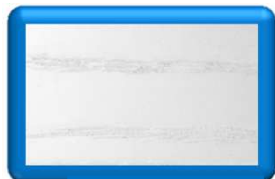
Frassino Laccato Bianco Poro Ap.